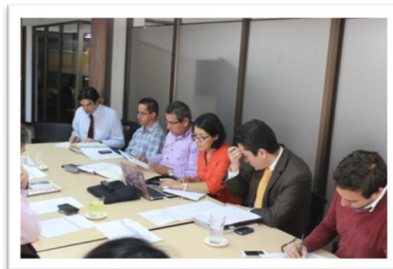
Aspectos de la reunión del OCAD Departamental del Cauca